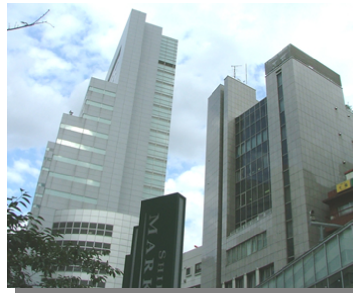
左側ビルは渋谷マークシティになります