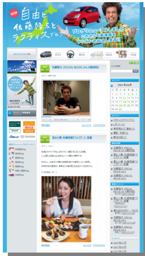
トヨタ様プロモーションブログ